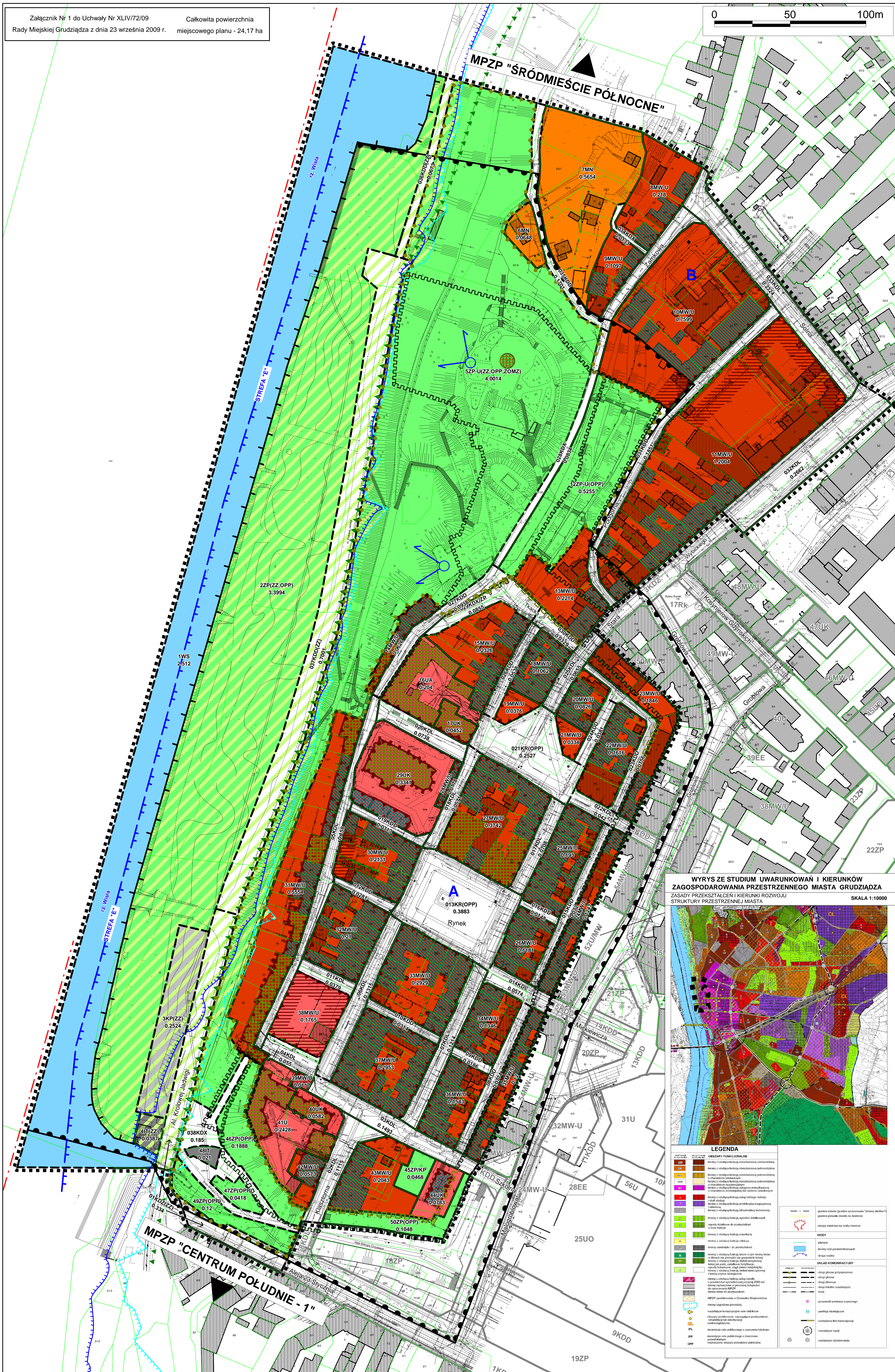
WYRYS ZE STUDYUM UWARUNKOWAŃ I KIERUNKÓW ZAGOSPODAROWANIA PRZESTRZENNEGO MIASTA GRUDZIĄDZA ZASADY PRZESZTAŁCEN I KIERUNKI ROZWOJU STRUKTURY PRZESTRZENNEJ MIASTA SKALA 1:10000